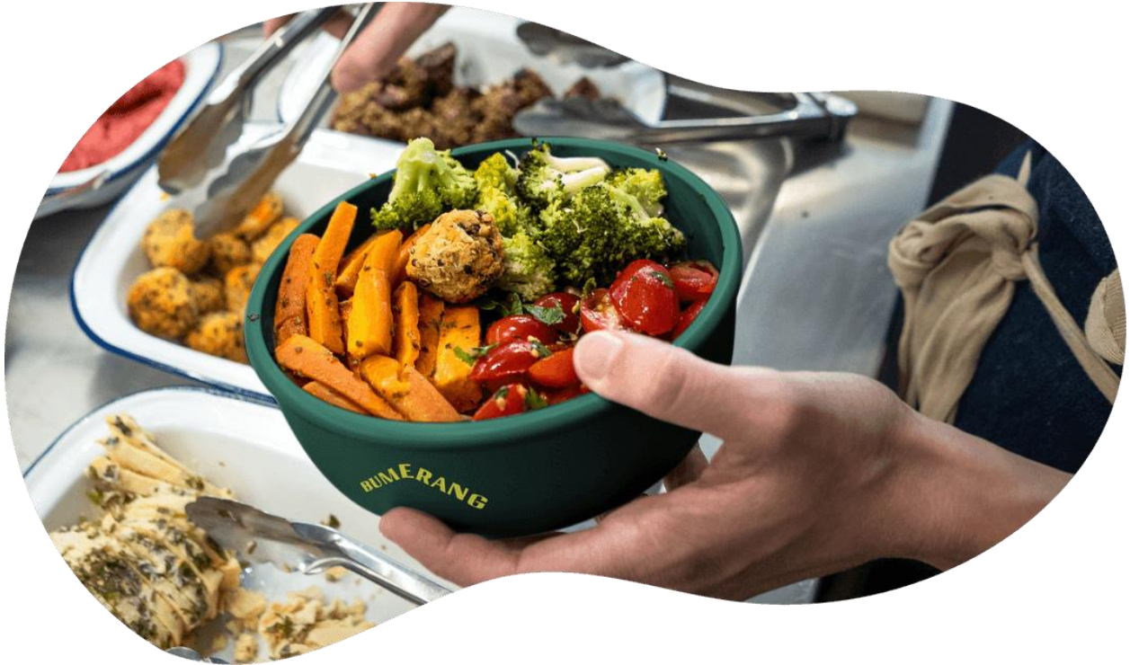
Figura 2. Ús dels envasos reutilitzables en serveis de càtering.

El funcionament del servei requereix el registre de dos actors principals, per una banda, l'empresa de restauració i, per l'altra, el client. Mitjançant una quota anual i sense clàusules de permanència, les empreses de restauració adquireixen el nombre d'envasos requerits i passen a formar part de la xarxa de Bumerang. Paral·lelament, el client interessat en consumir en envasos reutilitzables s'ha de registrar a l'aplicació mòbil de Bumerang per poder accedir a un codi personal que li permetrà utilitzar el servei en realitzar la seva comanda. Quan el restaurant rep la comanda, serveix el menjar dins dels envasos retornables, els tanca i escaneja el codi situat a la tapa per associar-lo al client que ha efectuat l'encàrrec, que no ha de pagar per fer ús del servei. Després del seu ús, el client (o qualsevol altra persona) té 15 dies per retornar l'envàs a qualsevol establiment integrant de la xarxa de Bumerang, que posteriorment s'encarregarà de la seva neteja. En cas que l'envàs no sigui retornat, el client serà penalitzat amb el cobrament d'un import de 6€ per cobrir el cost de l'envàs. En cas de tornar l'envàs fora de termini, el cobrament és reemborsat.