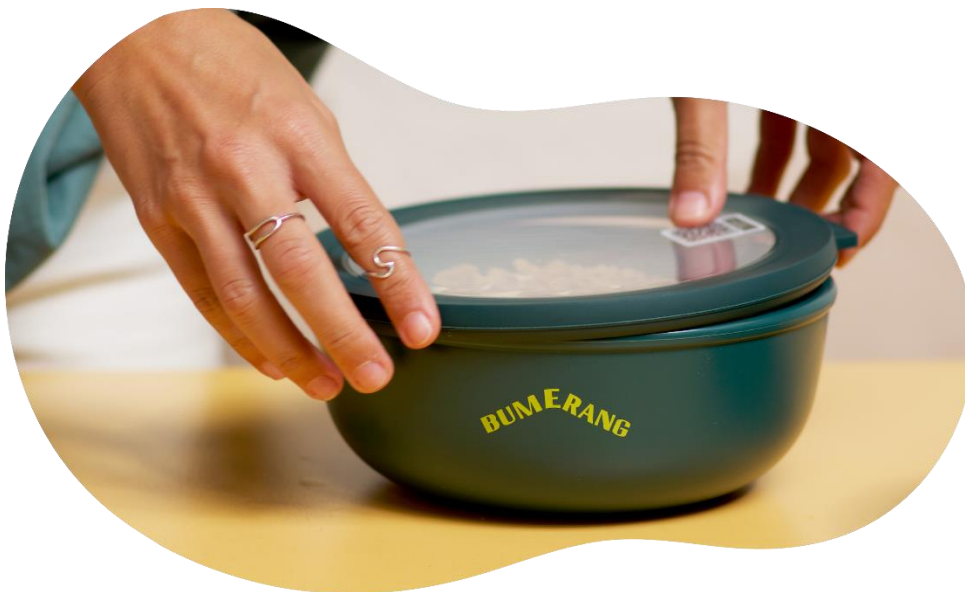
Figura 1. Recipients emprats per Bumerang.

Al febrer de 2020 neix l'empresa Bumerang a Barcelona (1.636.193 habitants 1 ), amb l'objectiu de proveir als establiments que ofereixen menjar per emportar un servei d'envasos retornables, en detriment dels envasos d'un sol ús. Concretament, el servei de Bumerang consisteix en subministrar contenidors i gots de plàstic retornables, lleugers, amb tancament hermètic, i aptes per microones, nevera, congelador i rentaplats industrial, entre els establiments que formen part de la seva xarxa de clients. Mitjançant aquests recipients amb una vida útil de fins a 200 usos (500 en el cas dels gots), ofereixen la possibilitat de retallar fins a un 30% els costos relacionats amb la compra d'envasos d'un sol ús, reduint així la generació d'envasos d'un sol ús, amb les dades exactes d'envasos estalviats.