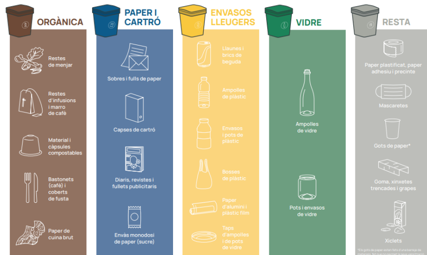
Figura 1. Cartell de recollida selectiva als edificis d'oficines. ARC, 2023.

Generalitat de Catalunya Departament d'Acció Climàtica, Alimentació i Agenda Rural Agència de Residus de Catalunya