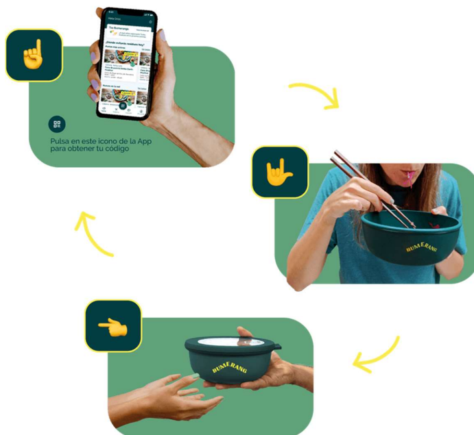
Figura 3. Funcionament esquemàtic de Bumerang per part de l'usuari.