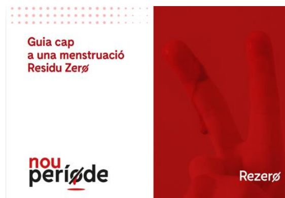
Figura 2. Portada de la Guia cap a una menstruació Residu Zero.

A l'octubre de 2020 es va publicar la guia del programa, on s'inclou una anàlisi dels efectes derivats dels productes menstruals d'un sol ús 1 en comparació amb els efectes dels productes menstruals reutilitzables, tenint en compte valors ambientals, econòmics i socials.