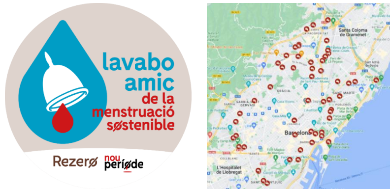
Figura 3. Logotip i mapa interactiu de Lavabos amics de la Menstruació Sostenible.

sempre que compleixi els requisits i serveis necessaris, els quals són validats a través de fotografies per part de l'entitat Rezero. Es pot consultar la ubicació de tots els equipaments de Barcelona amb distintiu mitjançant un mapa interactiu.