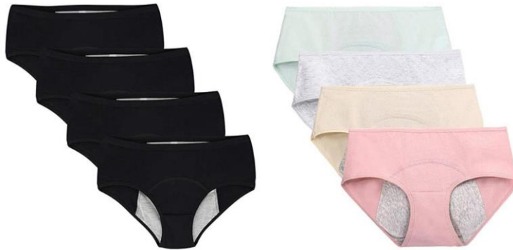
Figura 4. Roba interior amb interior absorbent.