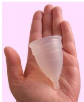
Figura 2. Copa menstrual de silicona.