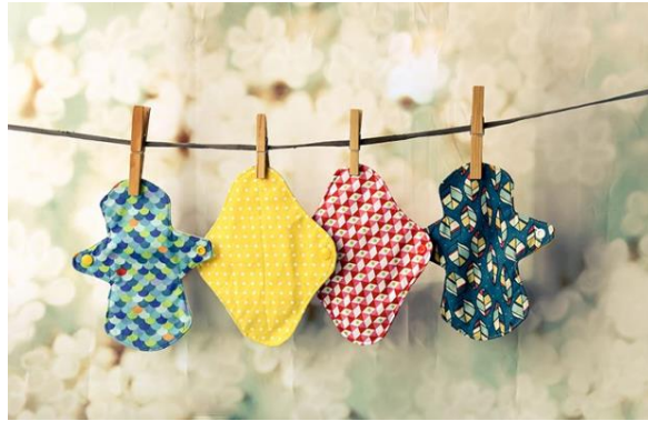
Figura 3. Compreses de tela.