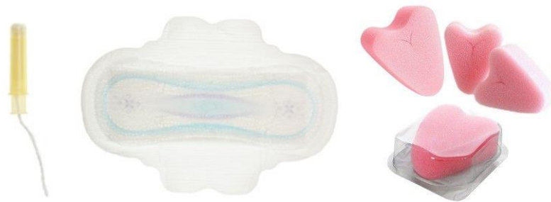
Figura 1. Tampons, compreses i esponges d'un sol ús.

Els productes menstruals d'un sol ús presenten un seguit d'impactes ambientals i econòmics, destacant: