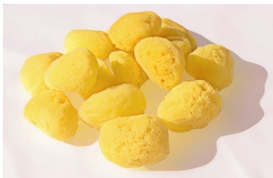
Figura 5. Esponges marines absorbents.