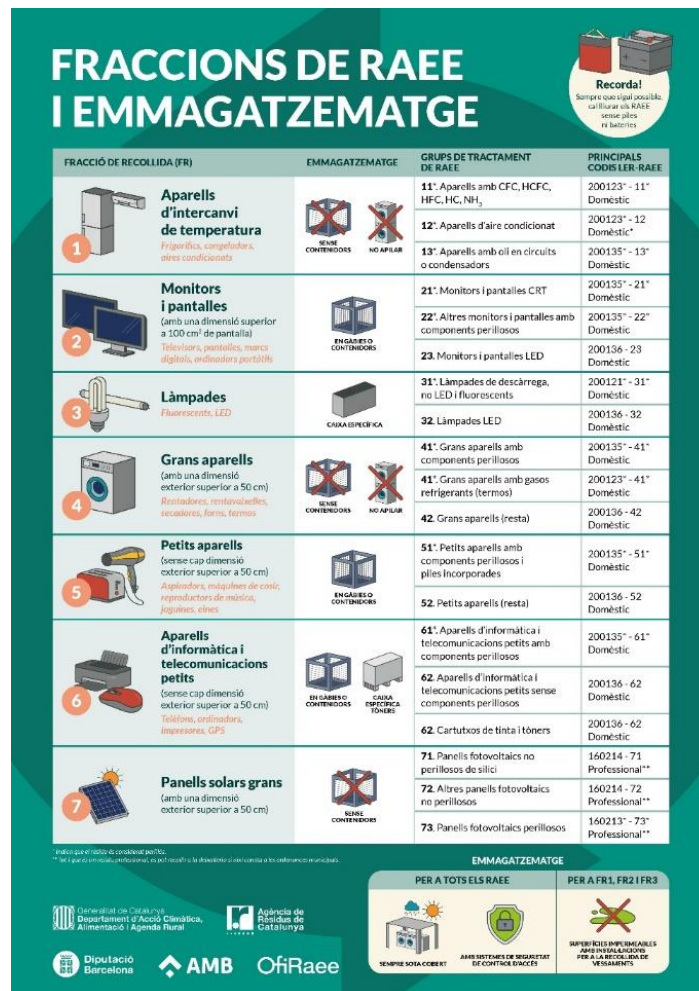
Figura 2. Distribució dels diferents fraccions de RAEE i com emmagatzemar-los, a partir dels criteris exposats en el Decret Llei 110/2015.

La Directiva 2012/19/UE marca el funcionament de tot el procés de gestió dels RAEE en matèria de prevenció, distribució, reciclatge i reutilització. Per altra banda, es fixen els objectius a assolir de cara als pròxims anys: