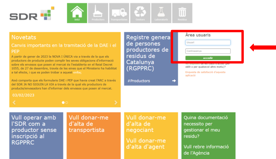
Figura 6. Interfície de l'àrea privada de la pàgina web del SDR. Font: SDR, 2023.

Fase 1. Accedir al SDR (Àrea d'usuari perfil de l'ens local)