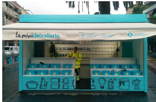
Figura 5. Minideixalleria de Castelldefels.

Quan els RAEE a les llars particulars o a les botigues no es traslladin a una plataforma logística ni a una deixalleria, sinó directament a un gestor d'emmagatzematge o tractament de RAEE, aquest transport es considera un trasllat de residus. Per tant, el transportista haurà de ser transportista de residus registrat i li serà aplicable la regulació del Reial decret de trasllats, aquest haurà d'anar acompanyat del document d'identificació.