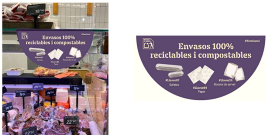
Figura 6. Exemple dels elements visuals presents als establiments per tal d'informar al consumidor sobre els nous packaging.

En aquest sentit, l'acceptació de les noves bosses compostables per part dels consumidors ha estat notablement favorable. A tots els punts de venda i establiments s'explica a través de cartells visuals aquestes iniciatives per tal que els consumidors estiguin informats i coneguin la correcta gestió d'aquests envasos.