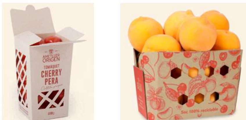
Figura 3. Envas compostable fet amb residu de canya de sucre (esquerra) i safata de cartró 100% reciclable elaborada amb fusta (dreta)

En aquest context, Ametller Origen aposta per alternatives innovadores les quals promouen la reducció de l'impacte ambiental. En el cas dels envasos de tomàquet cherry de 400g i de la carn de la secció de la carnisseria, són compostables, els quals s'han elaborat a partir de residu de canya de sucre i que porten tintes d'origen vegetal. Per altra banda les safates de la fruita són de cartró obtingudes a partir de fusta sostenible.