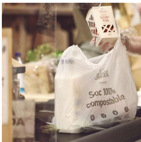
Figura 4. Exemple de bosses de caixa de material compostable entregades a les botigues d'Ametller Origen.

També, s'han eliminat les bosses de plàstic de nanses i s'han substituït per bosses reutilitzables de ràfia, bosses reciclables de paper, bosses compostables de nanses i, en algunes botigues, caixes de cartró reutilitzable de fruita i verdura. D'aquesta manera s'elimina el plàstic d'un sol ús i es redueix les emissions de CO 2 .