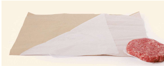
Figura 5. Imatge del paper d'embolcar per a productes càrnics i embotits, constituït per dues fraccions fàcilment separables.

Actualment, s'han eliminat tant les bosses de plàstic de servei com les de caixa per bosses amb materials biobasats i compostables, les quals posseeixen les corresponents certificacions de qualitat. També s'ha substituït el paper d'embolcar la carn i els embotits per paper que conté una capa amb una làmina de material compostable, per tal d'aportar més resistència seguint els mateixos criteris de sostenibilitat. Aquest paper d'embolcar ofereix la possibilitat de segregar els dos materials que el componen (la part de paper i la part de la làmina de material compostable), per tal que el consumidor tingui la facilitat de dipositar cada material a la seva corresponent fracció de recollida selectiva.