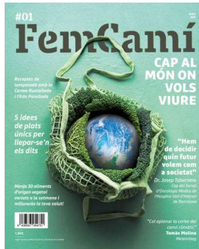
Figura 1. Volum 1 de la revista Fem Camí.

En aquest sentit, i per tal d'escollir les millors aplicacions amb plàstic compostable, Ametller Origen demana als seus fabricants d'envasos informació referent a: