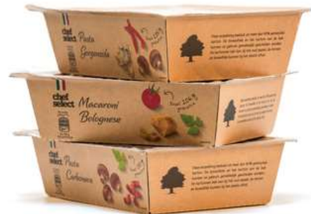
Figura 2. Envàs Halopack.

Es tracta d'un nou sistema de packaging reciclable, en el qual s'elimina un 80% del plàstic d'un sol ús. El nou envàs està elaborat de cartró reciclat i un film de plàstic que es troba adherit mitjançant un procés de calor per protegir i aïllar l'aliment, el qual proporciona un augment de la vida útil dels aliments frescs. En aquest cas, només s'ha de separar el cartró i el film de plàstic per dipositar el cartró al contenidor corresponent. Aquest envàs, es troba