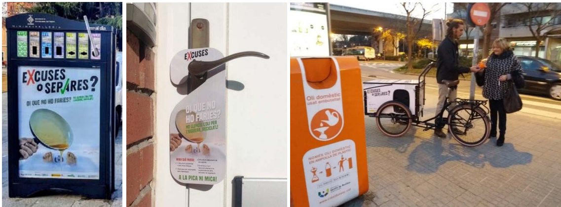
Figura 5. Actuacions de sensibilització per tal d'incrementar l'ús del servei de recollida d'oli vegetal usat.