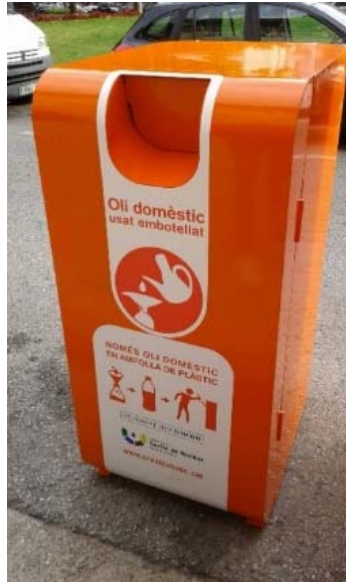
Figura 2. Contenidor específic per al dipòsit oli vegetal usat al Vallès Occidental.

Així mateix, en el següent mapa es pot consultar la ubicació actual dels contenidors de recollida d'oli gestionats des del consorci al municipi de Terrassa.