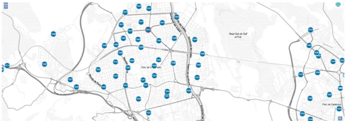
Figura 3. Mapa parcial amb la xarxa de contenidors per a la recollida d'oli usat al Vallès Occidental.

Així mateix, en el següent mapa es pot consultar la ubicació actual dels contenidors de recollida d'oli gestionats des del consorci al municipi de Terrassa.