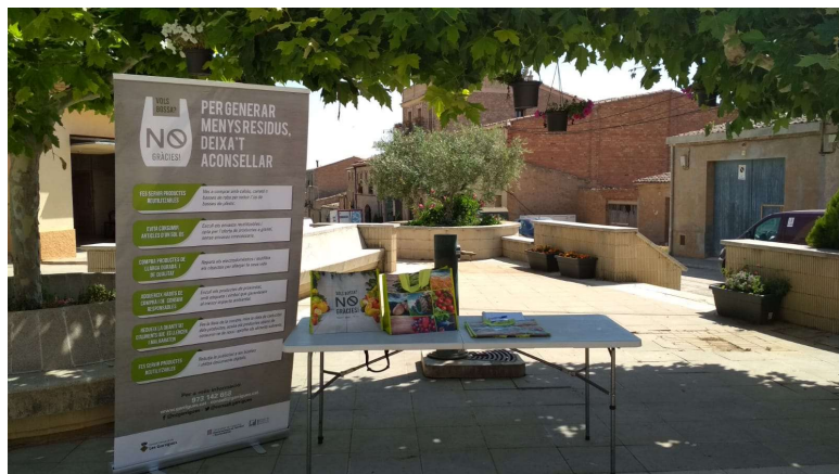
Figura 1. Campanya per a la reducció en la generació de residus.