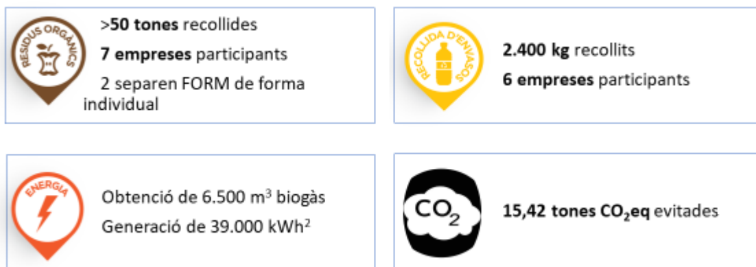
Figura 3. Infografia dels resultats obtinguts per el circuit privat de recollida de residus de l'Eix Besòs Circular entre gener i novembre de 2020

Els impropis del circuit privat de recollida de fracció orgànica de l'Eix Besòs Circular es situen en el 5,4%, segons les dades de l'última caracterització efectuada, el setembre de 2020.