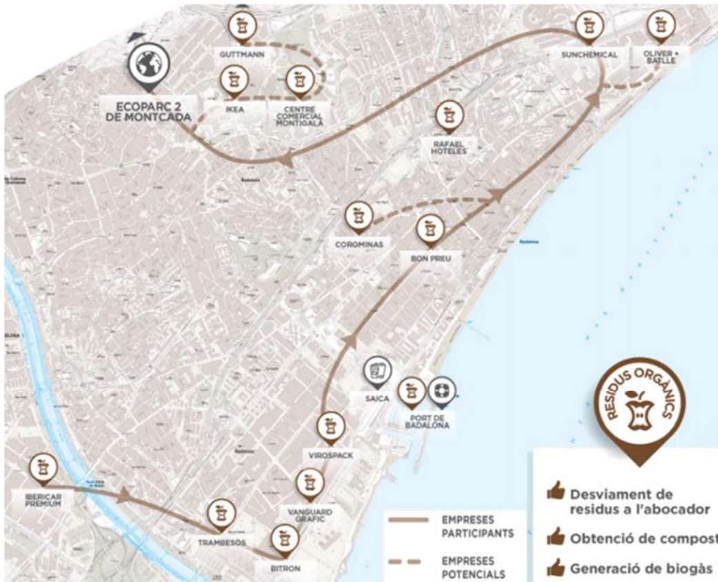
Figura 2. Circuit privat de recollida selectiva de la fracció orgànica establert per l'Eix Besòs Circular

En la següent figura es pot visualitzar el circuit de recollida establert per l'Eix Besòs Circular 2 .