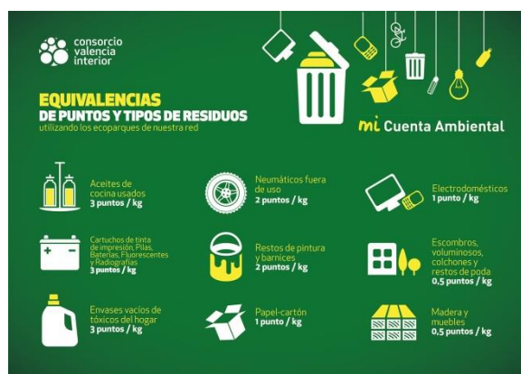
Figura 1. Targeta "Mi Cuenta Ambiental" i equivalències de punts i tipus de residus.