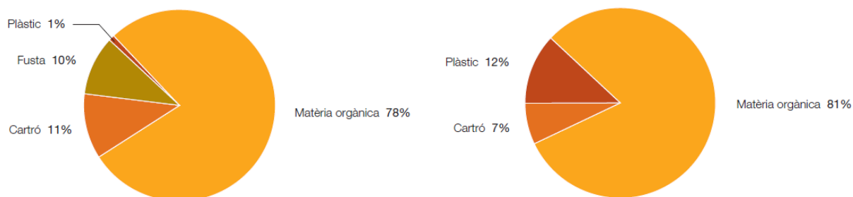
Figura 1a. Distribució de la generació mitjana anual de residus: a la parada de venda de fruita i verdura (esquerra); i, a la parada de venda de carn (dreta).

El residu que es genera en major quantitat a un mercat municipal és la fracció orgànica, principalment a les parades de venda de fruita i verdura (78% de la generació total en pes), a les parades de venda de carn (81% de la generació total en pes) i a les parades de venda de peix i marisc (76% de la generació total en pes).