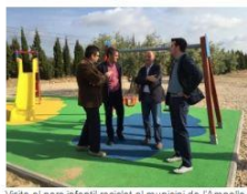
Visita al parc infantil reciclat al municipi de l'Ampolla.

De tota la comarca, el municipi de l'Ampolla és el que més quilos d'envasos i vidres ha recollit per habitant