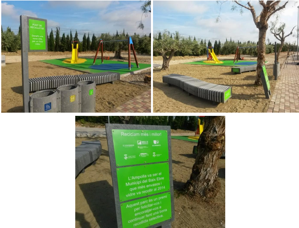
Figura 1. Parc infantil construït a partir de Syntrewood instal·lat a l'Ampolla, al ser el municipi del Baix Ebre que més quilos d'envasos de plàstic i vidre va reciclar durant l'any 2014.