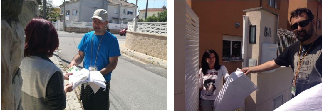
Figura 4. Educadors ambientals informant i lliurant saques als ciutadans de Torredembarra.

Durant els dos anys que va durar la posada en marxa del nou sistema de recollida de poda, es van fer campanyes informatives i de conscienciació a la població amb educadors ambientals.