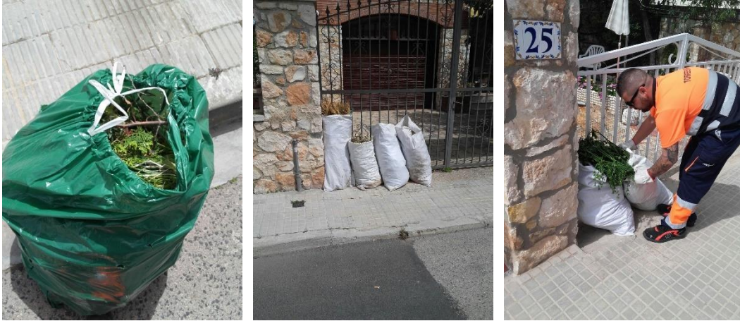
Figura 2. Recollida porta a porta de la fracció vegetal a Torredembarra.

Els ciutadans han de deixar les restes de gespa i fulles en saques de ràfia de 30x50 cm proporcionades per l'Ajuntament davant la porta del seu habitatge, mentre que les branques les han de deixar lligades. En aquest sentit, cada barri té assignat un dia de recollida, el qual coincideix en cap de setmana o dilluns per afavorir la participació de les segones residències. No obstant això, els ciutadans també poden portar la poda gratuïtament a la planta de tractament de l'empresa Nordvert.