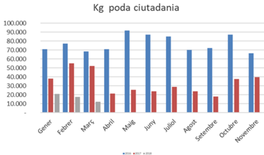
Figura 5. Evolució de la quantitat de poda ciutadana recollida (kg) entre 2016-2018.

Si s'analitzen les dades de la quantitat de poda recollida després de la implementació del nou sistema de recollida, s'observa com s'ha produït una disminució de més d'un 40% de la quantitat recollida, evitant així, l'ús indiscriminat del servei per part de jardiners professionals.