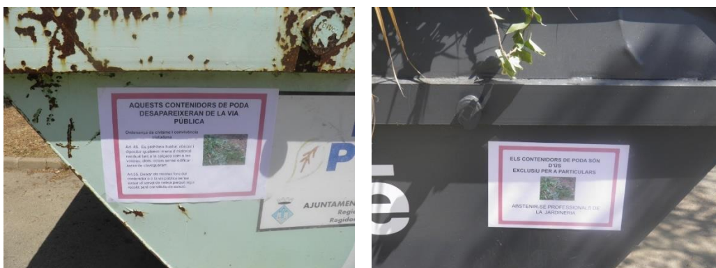
Figura 1. Cartell informatiu avisant de la retirada dels contenidors (esquerra); i, cartell d'avertiment als professionals de la jardineria (dreta).

Torredembarra és un municipi del Tarragonès amb una població de 15.726 habitants (Idescat, 2017). Ara fa uns anys, l'Ajuntament d'aquest municipi va decidir impulsar la recollida de la fracció vegetal mitjançant caixes metàl·liques, però l'ús indegut per part de professionals de la jardineria i el llançament d'objectes voluminosos, amb desbordaments constants de les caixes habilitades per a la seva recollida, va conduir a un replantejament del sistema.