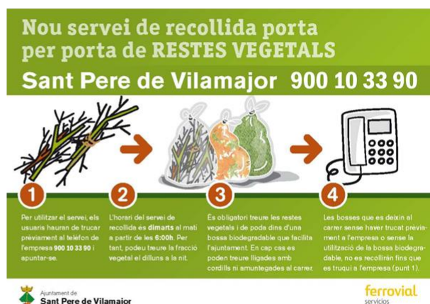
Figura 1. Tríptic informatiu sobre la recollida de la fracció vegetal editat per l'Ajuntament de Canet de Mar (esquerra) i l'Ajuntament de Sant Pere de Vilamajor (dreta). Font: Ajuntament de Canet de Mat i Ajuntament de Sant Pere de Vilamajor, 2017.