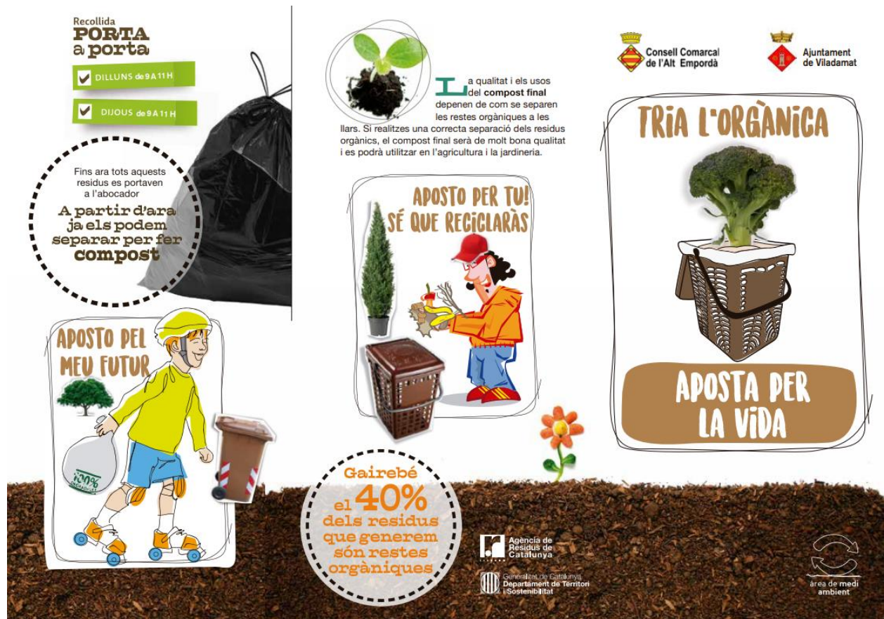
Figura 2. Tríptic informatiu (I/II). Font: Consell Comarcal de l'Alt Empordà, 2018.

Els veïns dels carrers del nucli havien de deixar el cubell i la bossa compostable a la porta de la seva llar els dilluns i dijous, essent el personal de l'Ajuntament l'encarregat de recollir les bosses i traslladar-les fins al compostador mecanitzat. Aquest compostador té una capacitat d'uns 200L o 75 kg per dia (calculat amb una densitat de 350 gr/L), la qual cosa permetria tractar la matèria orgànica d'un centenar de llars.