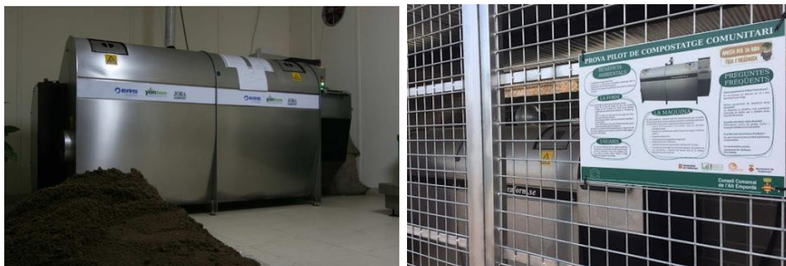
Figura 1. Compostador mecanitzat.

En aquest sentit, la prova de Viladamat, subvencionada per l'Agència de Residus de Catalunya i el Ministeri d'Agricultura i Pesca, Alimentació i Medi Ambient, pretenia estudiar la viabilitat d'autogestionar la fracció orgànica dels residus municipals domèstics mitjançant el compostatge casolà i la recollida porta a porta de la fracció orgànica amb l'ús d'un compostador mecanitzat per les llars que no els era possible realitzar el compostatge casolà.