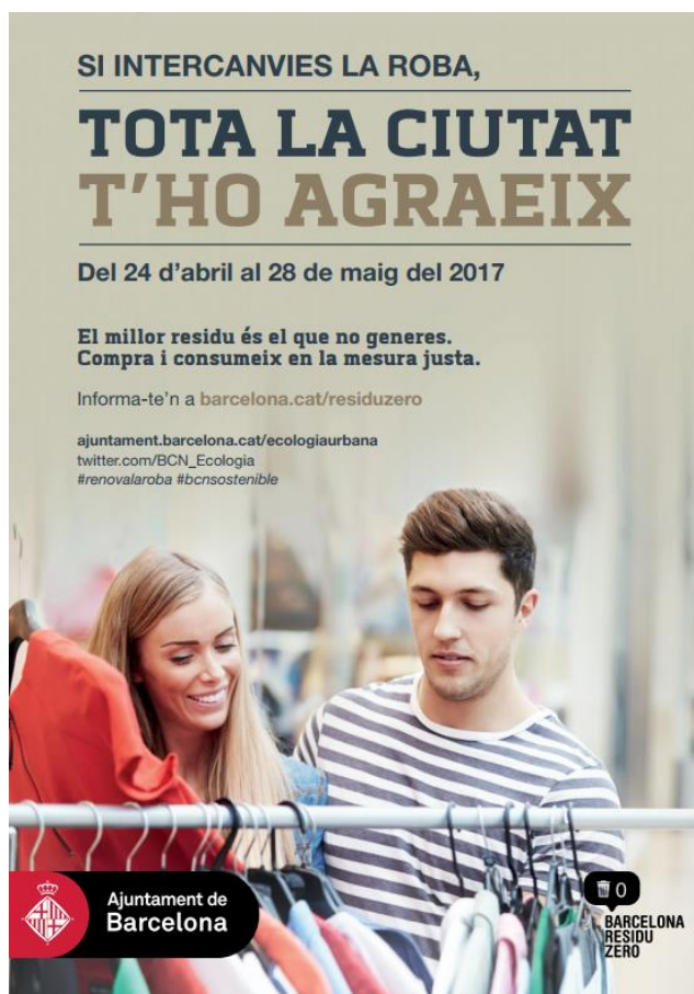
Figura 2. Campanya Renova la teva roba. Ajuntament de Barcelona, 2017.

Els punts d'intercanvi de roba no s'encarreguen de rentar o arreglar la roba, per tant, és important que la roba estigui neta, en bon estat de conservació, sense forats, descosits ni taques. Addicionalment, cal destacar que no s'accepten sabates, roba interior ni de la llar, essent 10 el nombre màxim de peces a intercanviar per persona.