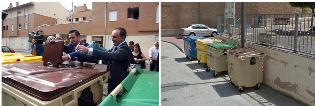
Figura 1. Presentació dels nous contenidors amb pany per a la recollida de la matèria orgànica a Peralta (esquerra) i contenidor per a la recollida de la matèria orgànica a Milagro (dreta).

Es tracta d'un sistema de participació voluntària que funciona mitjançant l'ús d'una clau que s'entrega a totes aquelles persones que s'inscriuen al programa. La inscripció s'ha de realitzar a les oficines d'algun dels ajuntaments de la Mancomunitat o a les pròpies instal·lacions de la Mancomunitat, firmant un compromís previ de compliment dels objectius del programa: només dipositar matèria orgànica i tenir cura de la clau, la qual és personal i intransferible.