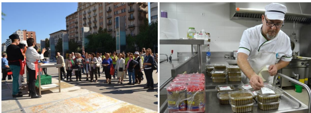
Figura 3. Programa per a la recuperació d'aliments frescos per a persones sense recursos econòmics a Reus (II/II).