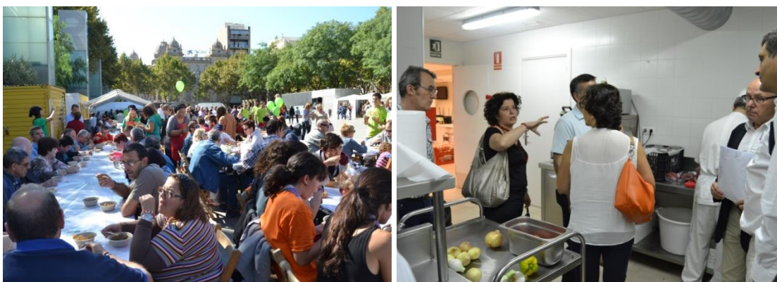
Figura 2. Programa per a la recuperació d'aliments frescos per a persones sense recursos econòmics a Reus (I/II).

Els menjadors socials cuinen aquests aliments frescos, que juntament amb els aliments cuinats i congelats procedents dels càterings, són servits presencialment al propi menjador o entregats en format menú carmanyoles a famílies que ho necessiten, segons el criteri dels tècnics de Serveis Socials de l'Ajuntament de Reus i de Càritas. Gràcies a aquest programa, bona part dels aliments de les superfícies comercials que acabaven esdevenint un residu, ara es recuperen per donar-los una nova oportunitat.