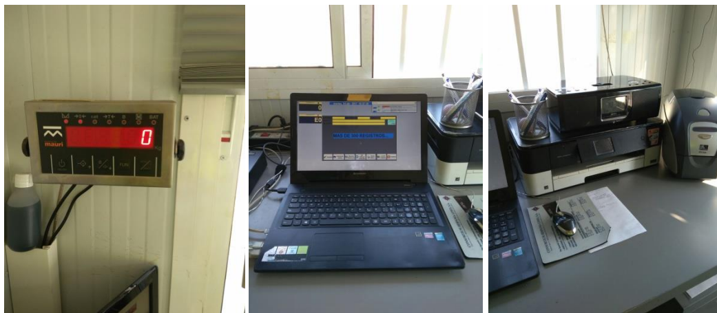
Figura 1. Sistema d'identificació i pesatge a la deixalleria mancomunada d'Alella, el Masnou i Teià. Font: Ferroviàl Servicios, 2017.