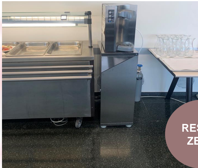
Gerres i gots de vidre a disposició dels usuaris