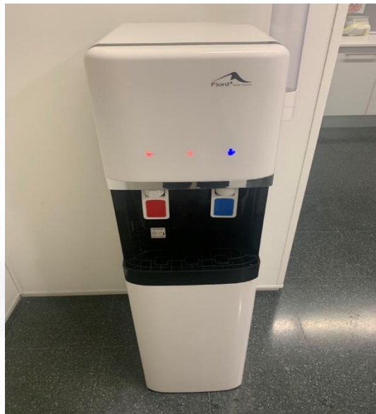
Fonts d'aigua connectades a la xarxa