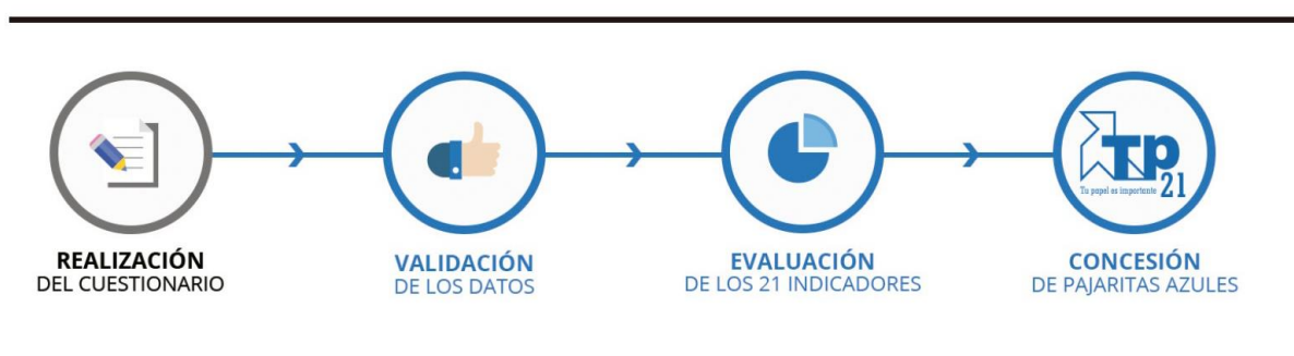
Figura 1. Programa Pajaritas Azules. ASPAPEL, 2018.

L'avaluació es realitza en base a 21 indicadors que s'agrupen en cinc blocs: recollida del contenidor blau, recollides complementàries, informació i conscienciació ciutadana, regulació i planificació i resultats i traçabilitat fins al reciclatge final. Cada un dels indicadors es valora segons uns barems establerts, essent la puntuació màxima que es pot assolir de 100 punts. En aquest sentit, aquells municipis que cada any destaquen entre els participats en el programa per assolir alts nivells d'excel·lència en la gestió de la recollida selectiva de paper-cartró se'ls hi atorguen pajaritas azules .