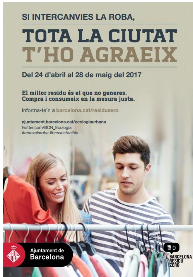
Figura 2. Campanya Renova la teva roba. Ajuntament de Barcelona, 2017.

Els punts d'intercanvi de roba no s'encarreguen de rentar o arreglar la roba, per tant, és important que la roba estigui neta, en bon estat de conservació, sense forats, descosits ni taques. Addicionalment, cal destacar que no s'accepten sabates, roba interior ni de la llar, essent 10 el nombre màxim de peces a intercanviar per persona.